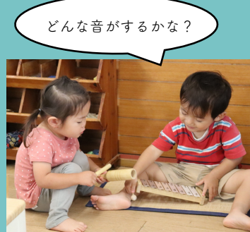
どんな音がするかな？