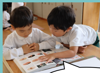
どんな虫がいるかな？