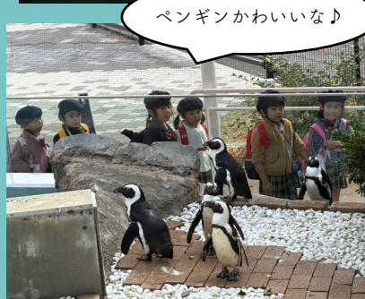
ペンギンかわいいな♪