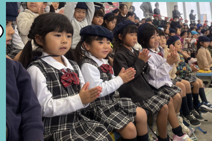
イルカショーは何度見ても ワクワクするね♪