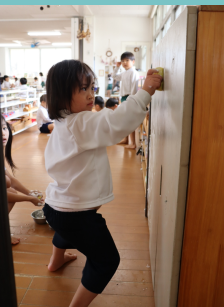
みんなのロッカーを 磨いているよ