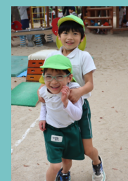
寒くなってきたけど、みんな 元気いっぱい走りまわってるよ～