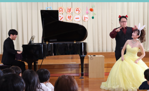
生の声量にみんなびっくり♪ ピアノの音色とぴったり合って素敵だったね