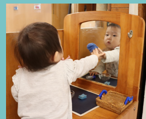
鏡をピカピカに磨いて 映った自分の顔にニコリ♪