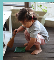
テラスのお掃除を してくれています